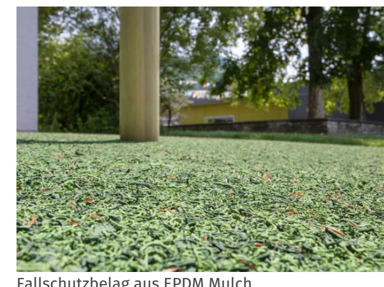
Fallschutzbelag aus EPDM Mulch