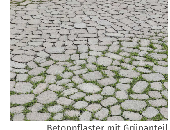
Betonpflaster mit Grünanteil