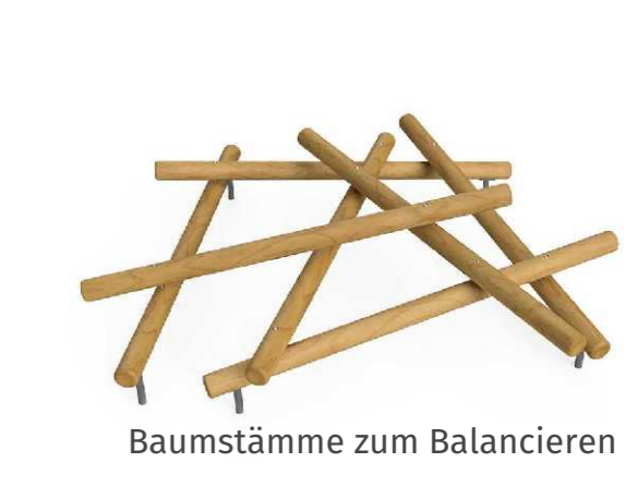
Baumstämme zum Balancieren