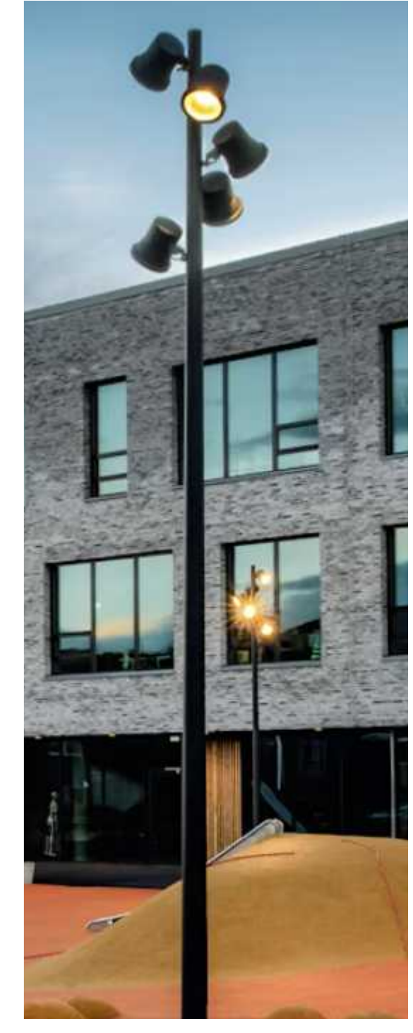
Aufsatzleuchte für Beleuchtung mit gerichtetem Licht