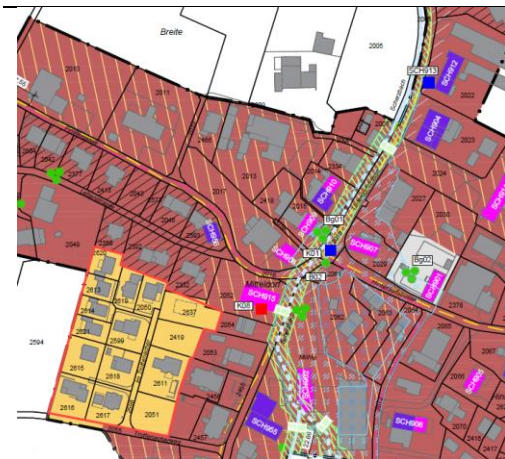
Ausschnitt Entwurf Bauzonenplan Dorfteil Scherz